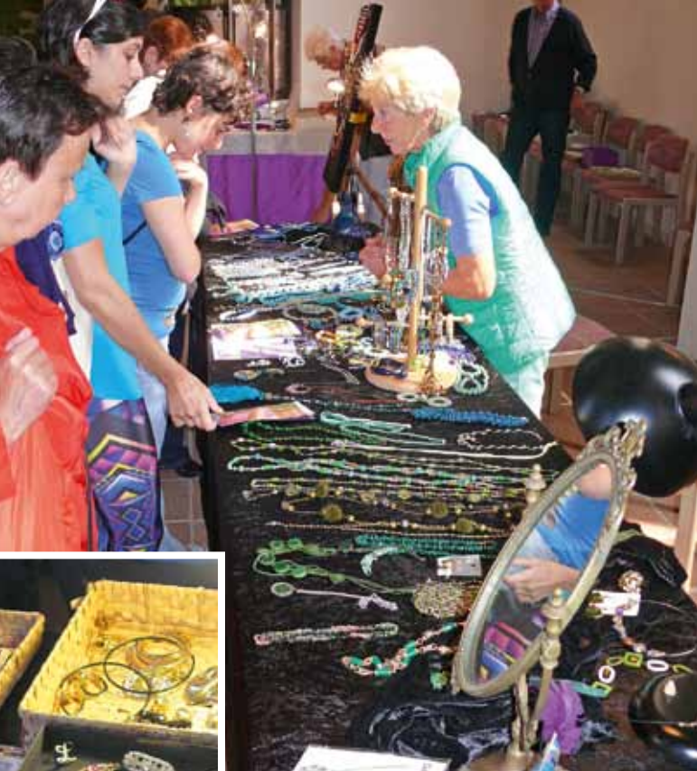
Reichhaltige Auswahl in allen Preislagen.