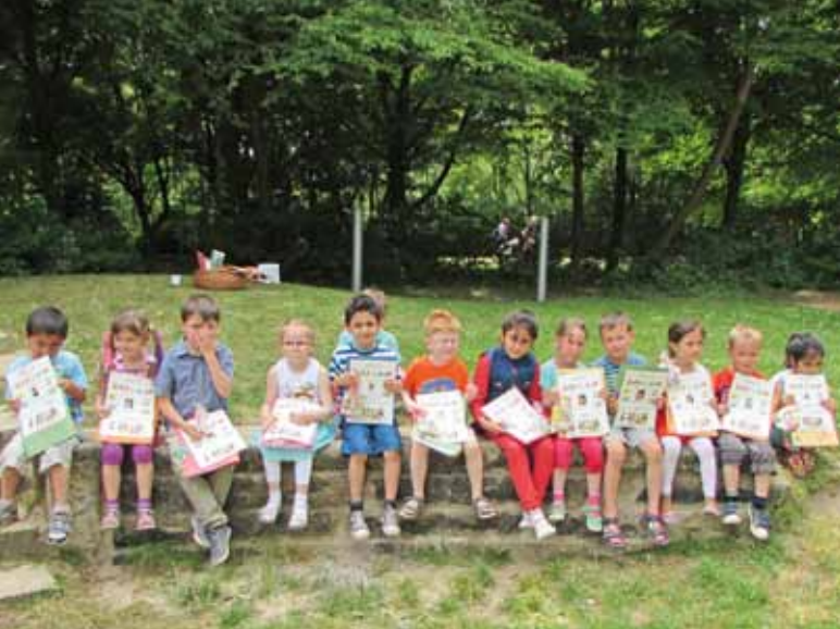
Die glücklichen Kinder mit ihren Hippy-Diplomen beim Abschlussfest.