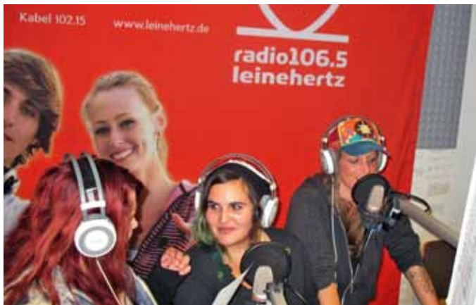
Im Studio mit Radio Sina.

Alexandra* blickt auf die Uhr ihres Smartphones und wartet darauf, dass der Empfangsdienst sie durch die Eingangstür lässt. In wenigen Minuten startet der Arbeitstag bei SINA. Ein freundliches „Guten Morgen“ und „danke“ werden ausgetauscht und schon sitzt sie an ihrem Schreibtisch im Radiobüro und fährt den PC hoch. Es ist Dienstag – ein Blick auf den Wochenplan zeigt, dass heute eine Redaktionsbesprechung ansteht. Außerdem hatte „Radio SINA“ gestern eine Livesendung bei Radio Leinehertz. Da Alex die Arbeitsab-