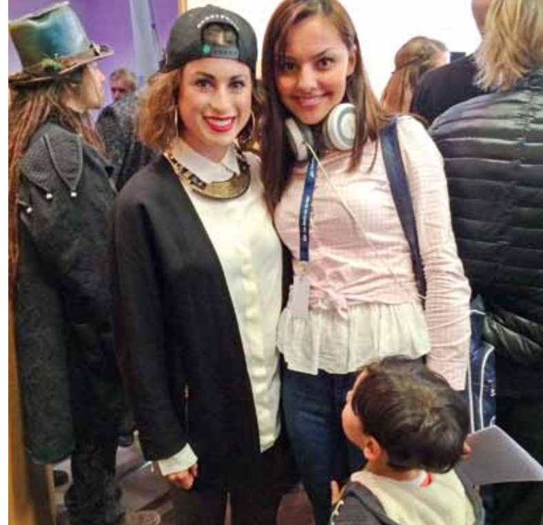
Pressekonferenz mit der englischen Sängerin Delilah.

Soziale Integration, neue Arbeit – dafür steht SINA. „Wir machen Frauen stark“, ist ganz groß in der Eingangshalle auf einem Banner zu lesen. Das Leitmotiv wird auf jede mögliche Art umgesetzt. Das Radiobüro ist nur ein Zweig, den SINA zur Qualifizierung bereithält. Auch im Schreib-, Veranstaltungs- und Medienbüro probieren sich bis