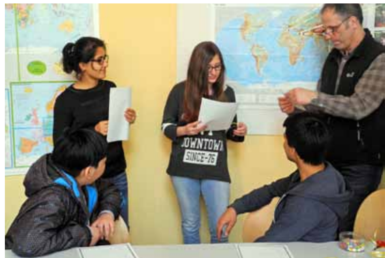
Beim gemeinsamen Lernen haben alle etwas beizutragen.

Viel Spaß boten auch die verschiedenen Ausflüge, die in der Woche stattfanden. So wurde an einem Nachmittag die Innenstadt Hannovers mit Hilfe einer Stadtrallye erkundet, welche im Rathaus endete, wo die Gruppe