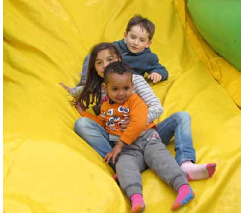
Während Mama sich beraten lässt, werden die Kinder betreut und gefördert.

Mit dem Asylantrag wird sie offiziell bei den deutschen Behörden registriert und beginnt die Zeit des Wartens. Über einen Asylantrag wird in der Regel innerhalb von zwei Jahren entschieden. Wird das Asyl abgelehnt, erhalten die Betroffenen die Aufforderung zur Ausreise. Dann kann man noch einen Härtefallantrag stellen, über den die Härtefallkommission entscheidet. Da kommt es nicht darauf an, welches Schicksal jemandem in seinem Heimatland droht, in das er abgeschoben werden soll, sondern, warum es eine besondere Härte wäre, ihn hier aus Deutschland zu entfernen. Dazu kann eine Erkrankung, die hier in Deutschland erfolgreich behandelt werden könnte, eine nahende Geburt, aber in Ausnahmefällen auch die besonders geglückte Integration in die deutsche Gesellschaft zählen. Viele hatten bisher noch keinen