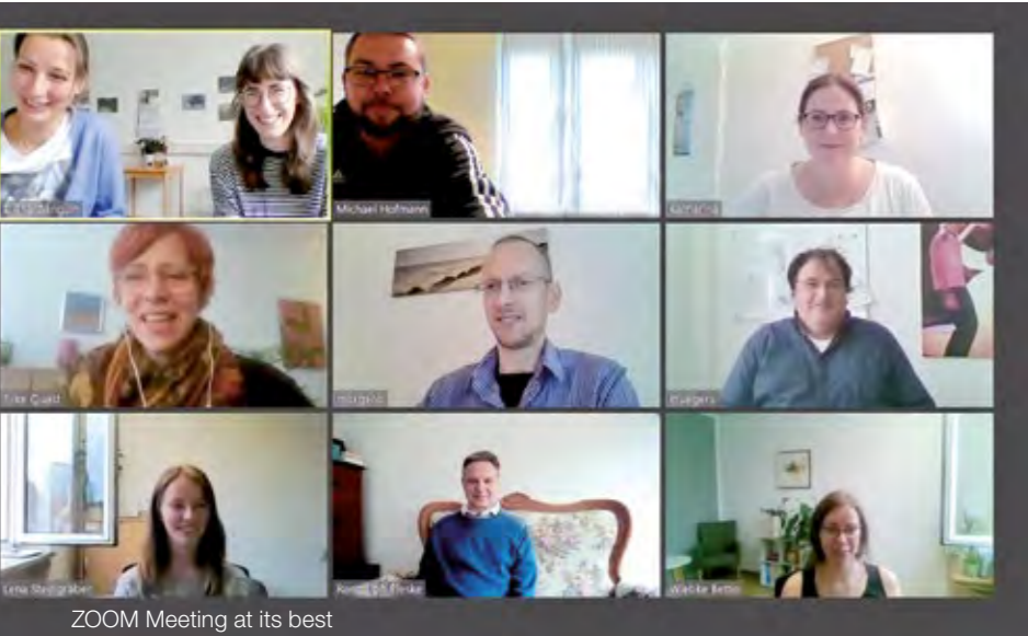
ZOOM Meeting at its best

Mehr Infos unter: 0511 9999 96-0 E-Mail: info@aufkurs-hannover.de www.aufkurs-hannover.de