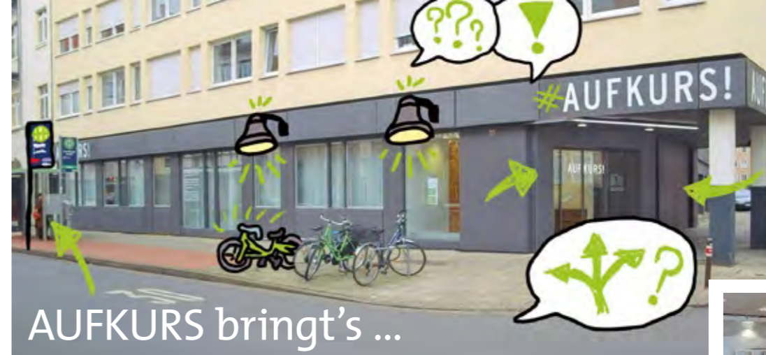
Einblicke in die Räume Calenberger Straße 22

wieder persönliche Gespräche stattfinden. Für manchen ist das therapeutische Gespräch bei uns das Highlight der Woche. Wir sind froh, dass wir Video-Beratungen durchführen können. Viele Klient:innen können sehr gut von Videogruppen profitieren. Besonders bei persönlichen Themen haben wir erlebt, dass sie sich durch die Geborgenheit in den eigenen vier Wänden mehr „öffnen“ können. Leider gibt es aber auch immer noch Klient:innen, die aufgrund von fehlender Privatsphäre oder technischen Voraussetzungen nicht an der Videogruppe