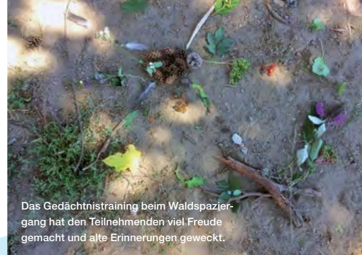
Das Gedächtnistraining beim Waldspaziergang hat den Teilnehmenden viel Freude gemacht und alte Erinnerungen geweckt.